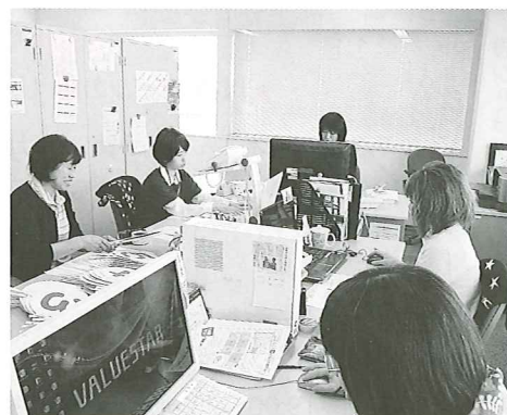
社員は全て女性。幅広い年齢の女性が皆活き活きと和やかに仕事に取り組んでいました

女性の地位向上、社会進出やワーク・ライフ・バランスについて論ずると、しばしば男性への対抗心だとか、ウーマンリブ的な考えと誤解されてしまうのですが、私が言っているのは全く違うのです。子を産み育てるといふ幸せや女性としての人生と仕事上のキャリアの両立を可能にし、女性の選択肢を豊かにすることです。また、専業主婦である母親の孤独感や不安を解消するためのネットワーキングなどを通じて、元気な女性を増やしたいと思っています。活き活きと輝く女性、元気な女性が会社や家庭で活躍することが、福島を、大きく言えば社会をも元気にする大きな原動力になるはずですよ。