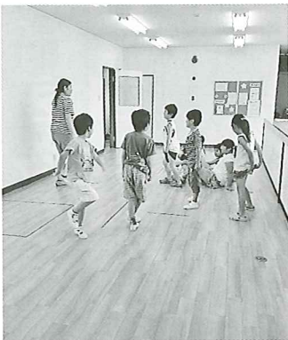
現在の学童クラブ。来月から広い場所に移転し、増々楽しい場に